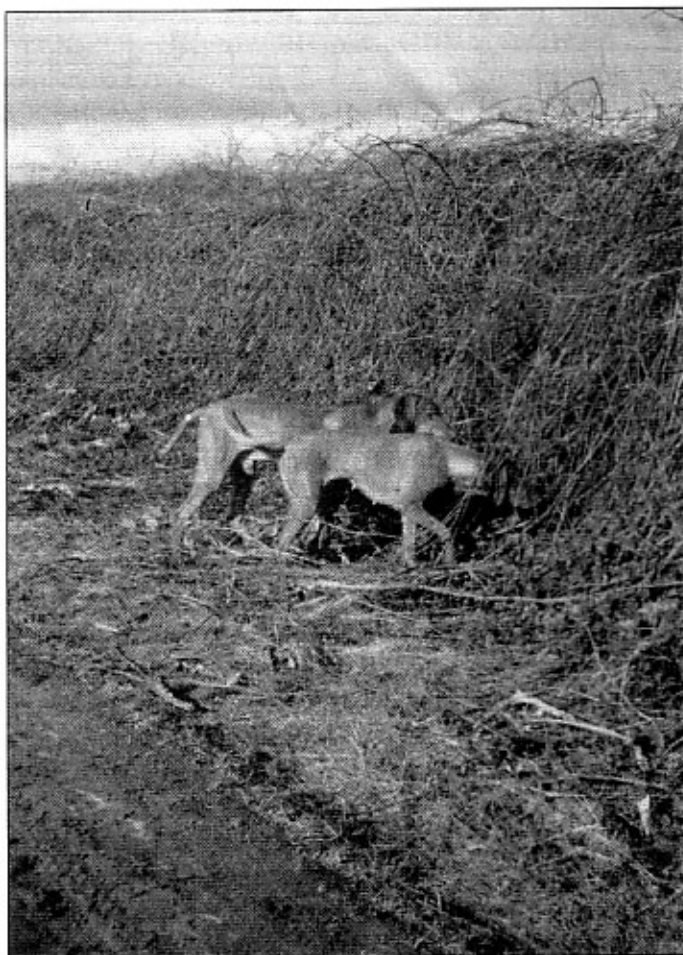
Páros vadmegállás a bozótosnál