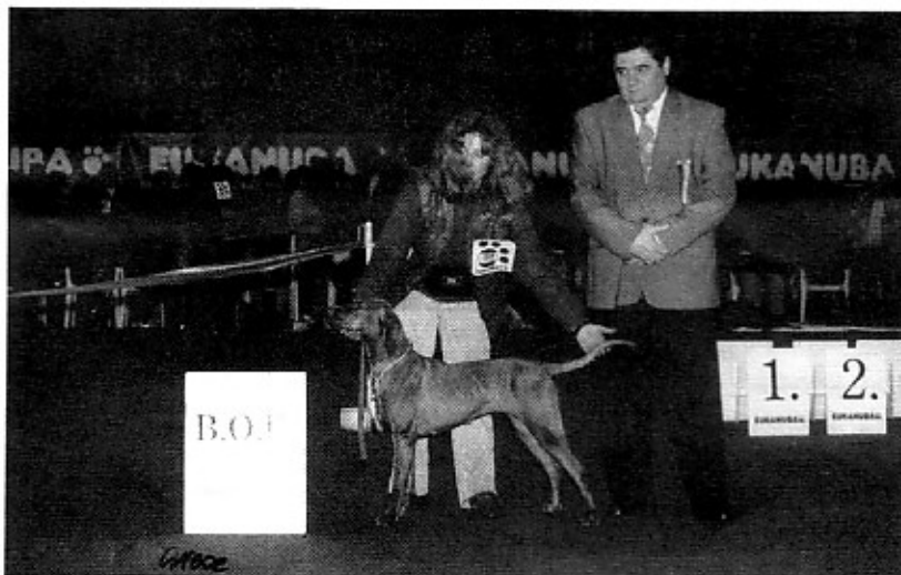
BK HCH Csatárkai Lärmás Champion Kiáll. BOB