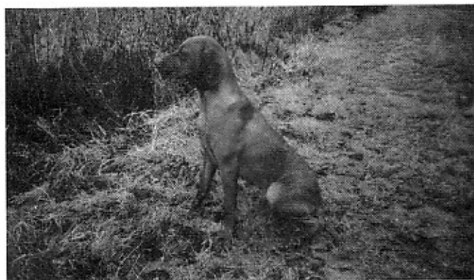
HJCH Csokolády Cony