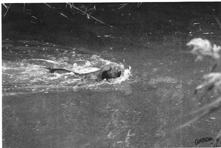
Vizsla a vízen

A "La Creste" díj: a speciális klubkiállítások legszebb kutyájának.