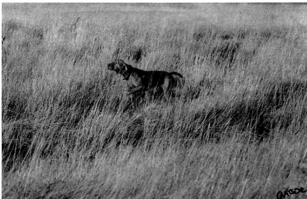
Vadmegállás