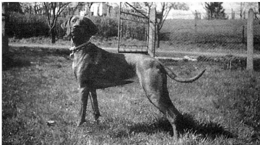
BK HCH Árvaváraljai Arany