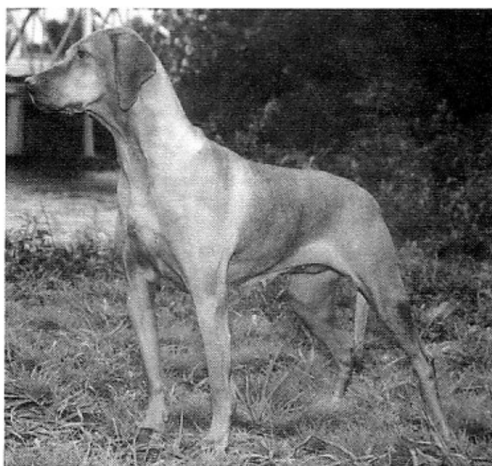
ICH Basafi Gigi BK HCH - Int. CA