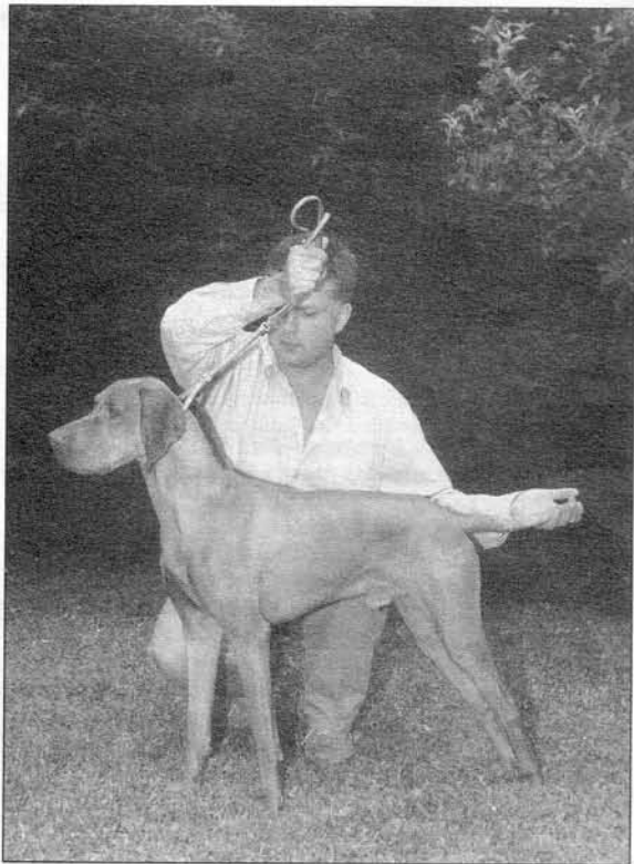
Fiatall Világgőztes Kan: Perbál-Menti Nike