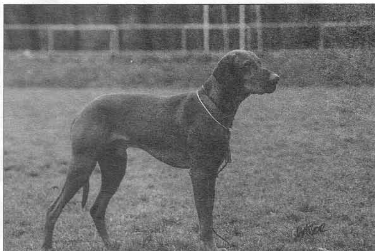
Nyílt o Kan. CAC, HDGY, HFGY Kalászi-Vadász Amstel

II. HELY Csatárkai Parázs HJCH Csatárkai Álmos - Csatárkai Lármás t.: Bernáth Katalin