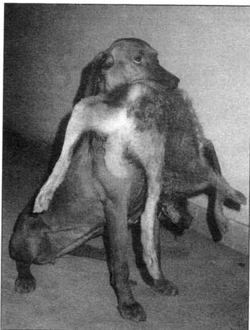
LUCANAPI KINCSEŐ

Már a szervezés során komoly aggodalmak merültek fel: nem lesz induló, nincs kutya. Végül 13 vizsla állt rajthoz - az előző évi 17 volt. Ez azonban nem az érdeklődés megcsappanásának következménye! Tudomásul kell vennünk, hogy ilyen komoly versenyre csak a vizslák krémje jut el, illetve a legmegszállottabb vizslások áldoznak csak annyi munkát kutyájuk felkészítésére, hogy helyük legyen egy komoly versenyen. Tudom, a körülmények sem kedveznek mindenkinek, de került már ki első díjas kutya a Belváros egyik V. emeleti lakásából úgy, hogy a vezetője nem vadásztársasági tag!