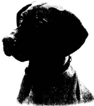
Magor Hisztis - CACIB, HFGY

A MVK az 1996-os Budapest-Bécs Kutyá Világkiállítás tiszteletére egy kiadvánnyal készül.