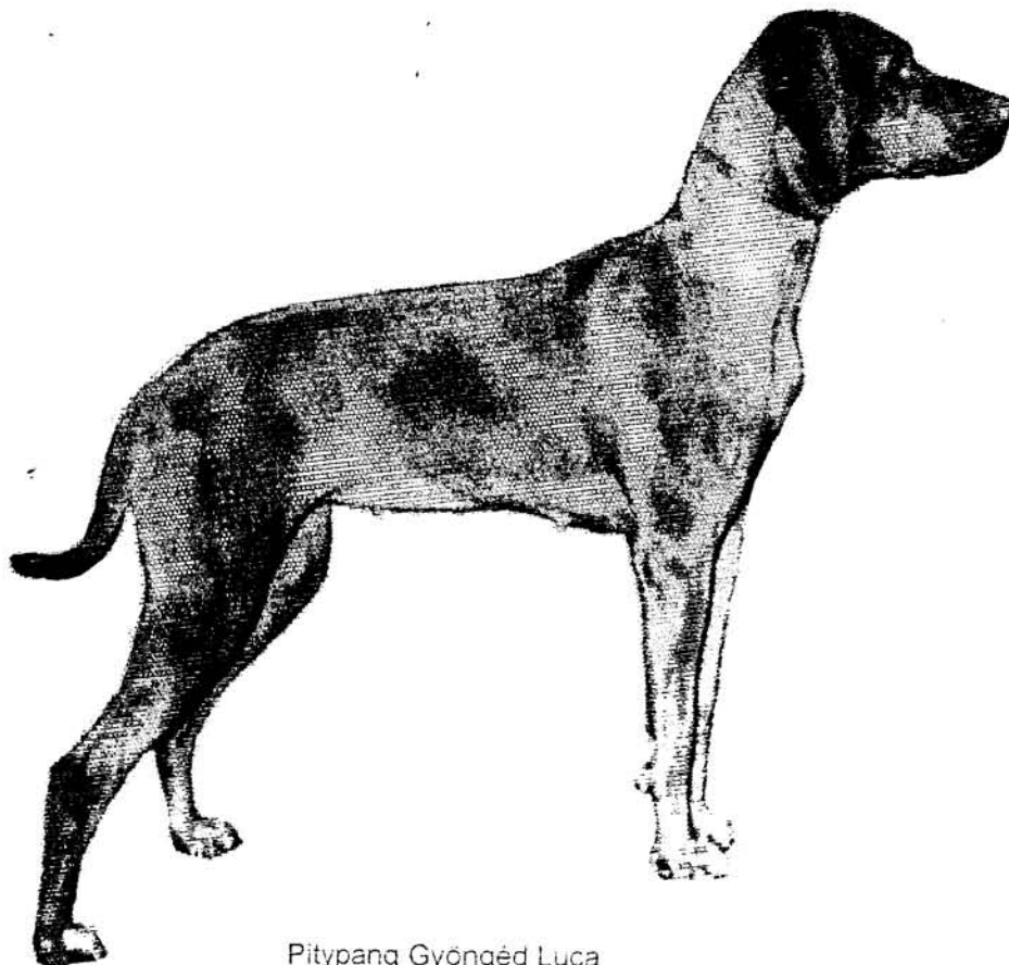
Pitypang Gyöngéd Luca